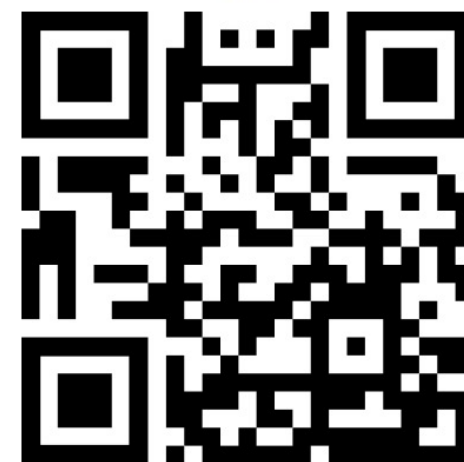
Канал Ильи Балахнина