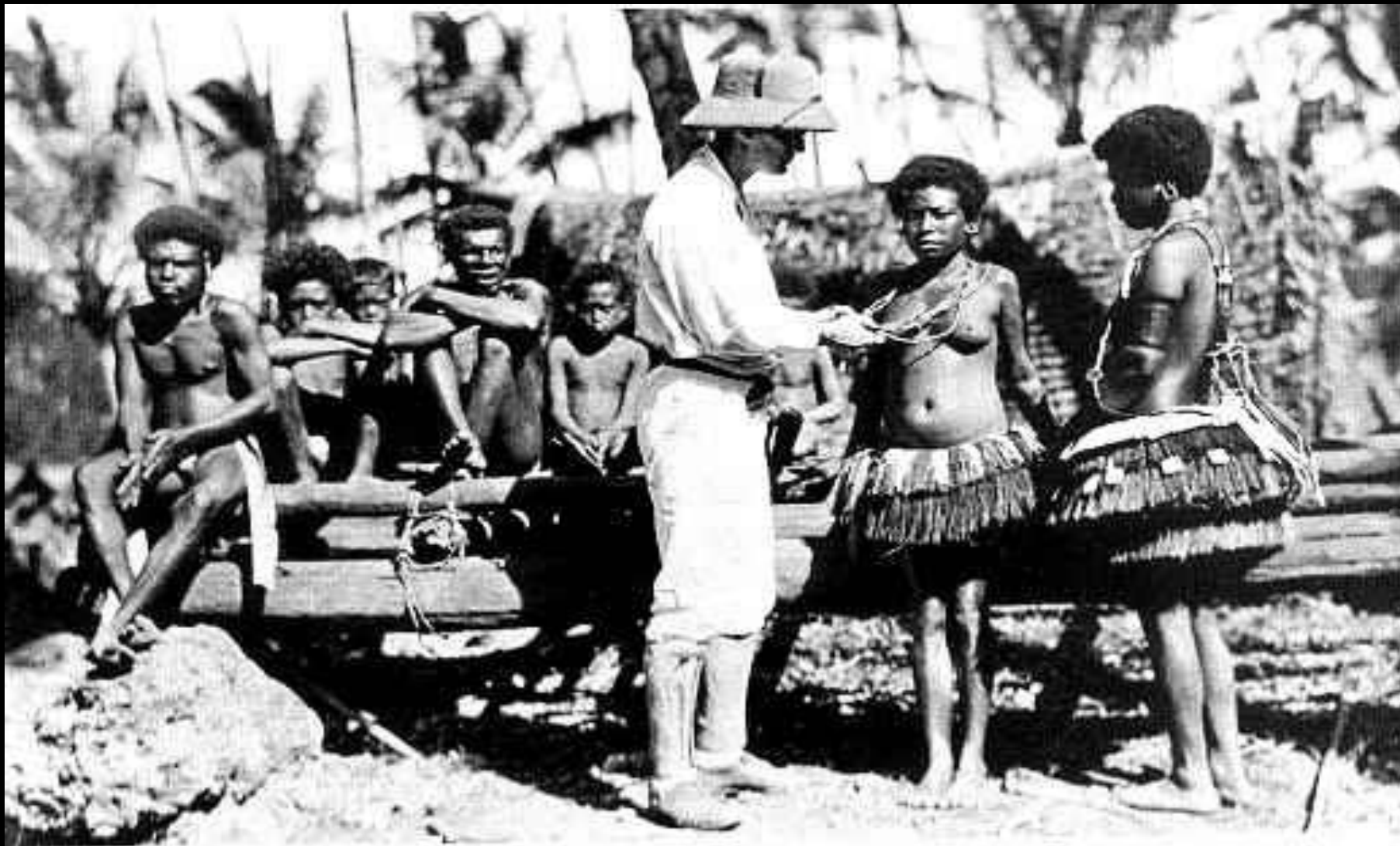
Б. Малиновский и тробрианцы